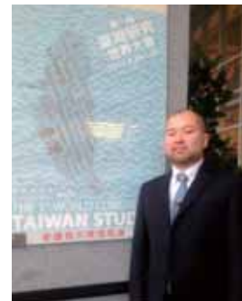
大会会場入り口にて筆者

ところで、38年間続いた戒嚴令が1987年に解除されるまで、台湾独立運動に対する懸念から、台湾内で台湾研究を行うことはタブーであった。こうした過去を鑑みると、戒嚴令解除後四半世紀という節目の年に（しかも、かつてと同じく国民党施政下で）開催された世界規模の台湾研究大会は、台湾社会の民主化をアピールするうえでも非常に意義深いものであったといえよう。初回となる本大会は成功裏に幕を閉じたが、国家の枠組みを超え、「地域研究」というディシプリンの下でその個性を発信し続ける台湾研究の魅力と意義が、今後も同大会を通じて一層グローバルな規模で認知されていくことを願ってやまない。